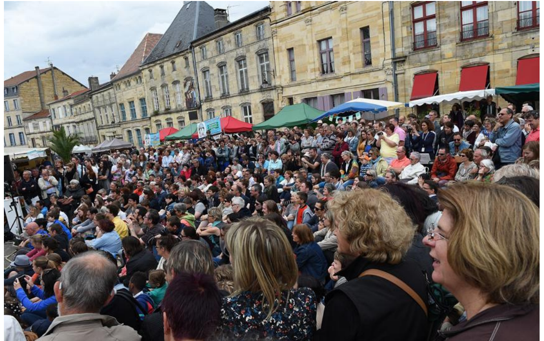
Des milliers de personnes sont attendus ce week-end à Bar-le-Duc pour le festival RenaissanceS, et il faut assurer leur sécurité avec des moyens renforcés.

« Nous allons également avoir le concours des bénévoles, acteurs vigilants, qui feront remonter des informations en cas d'incidents pendant toute la durée du festival. C'est un renforcement important en termes de sécurité et je pense que les festivaliers comprendront les petits désagréments. Il est donc demandé d'éviter d'avoir des sacs et de transporter des outils et même un couteau suisse sur eux »,